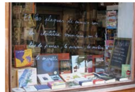
Des poèmes sur les vitrines des commerçants.