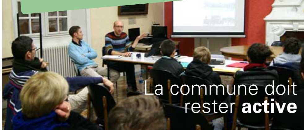
Réunion publique de concertation au sujet de la création de la zone ludique, animée par les architectes de Toposcope.

« Il apparaît que les résultats 2015 de votre collectivité sont excellents. Il convient de les maintenir à ce niveau pour l'avenir. » Dans une note envoyée fin octobre, la Direction générale des finances publiques fait part de ses conclusions quant à la qualité des comptes locaux de Villeneuve-de-Berg pour l'exercice 2015. La note du comptable public fait apparaître que sur les trois dernières années, la qualité comptable de Villeneuve se situe au-dessus de la moyenne nationale des villes de sa catégorie, une bonne qualité comptable étant indispensable à la bonne gestion de la collectivité.