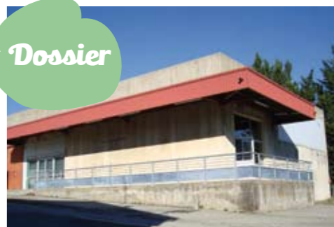
Rénovation du bâtiment l'Ardéchoise.