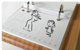
L'Effet de mes rides de Claude Delafosse France • 2022 • 12'

Fabriquer son compost, c'est faire pousser de la terre, c'est faire pousser de la vie. C'est l'histoire du temps qui passe et qui transforme un monde qui meurt en un autre nouveau, présent, futur et fécond.