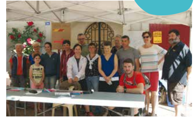
L'association du Petit-Tournon a organisé l'édition 2018 de sa marche à la caillette, dimanche 20 mai.