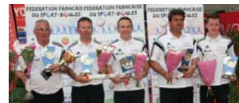
Les boulistes villeneuvois se sont distingués au National de Lyon Bellecour.