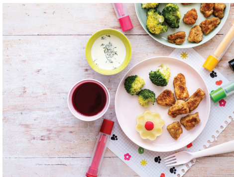
Le restaurant scolaire accueille environ 158 enfants par jour.

De plus, depuis septembre 2021, une tarification sociale pour la cantine est effective avec trois tarifs en fonction du quotient familial. Après quatre mois de fonctionnement, cette nouvelle tarification semble bien répondre à un besoin réel. En effet, entre septembre et décembre 2021, 8 245 repas ont été pris sur