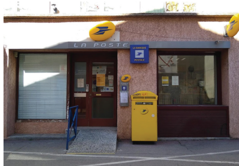
La Poste veut encore réduire les horaires d'ouverture du bureau de Villeneuve-de-Berg.

Le conseil municipal, arguant de la mobilisation pour redynamiser le centre-bourg, a fermement demandé à La Poste de revoir sa position, pointant les incohérences entre des engagements pris au niveau national et une pratique locale loin des problématiques des bourgs ruraux et de leurs habitants.