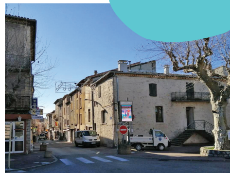
Objectif : redynamisation de l'activité commerciale.

Les commerces souffrent de la crise sanitaire, 44 % constatent un impact négatif de la crise sur leur activité. Ils observent aussi majoritairement (65 %) une dégradation de l'activité commerciale sur les dernières années. Le constat dressé est sans appel, il faut inverser la tendance et redynamiser l'activité commerciale. Une bonne nouvelle, les deux-tiers des commerçants en place ont des projets : rénovation, embauche ou encore développement de l'activité sont au programme.