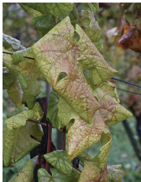
Une maladie de la vigne.

La flavescence dorée est une maladie incurable de la vigne causée par une bactérie circulant dans la sève. Elle occasionne de fortes pertes de récolte et peut compromettre la pérennité des vignobles. Elle est transmise