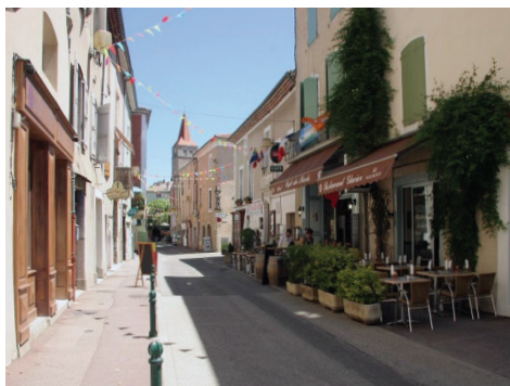
Les commerces sont au premier plan de la vie locale.

Sur les dernières décennies, la commune de Villeneuve-de-Berg a été confrontée à une tendance lourde : les commerces du centre-bourg tendent à se relocaliser en périphérie, voire à disparaître au profit d'une offre située dans les grandes zones commerciales. Cette évolution n'est pourtant pas une fatalité. Les élus disposent d'outils concrets pour accompagner le retour du commerce.