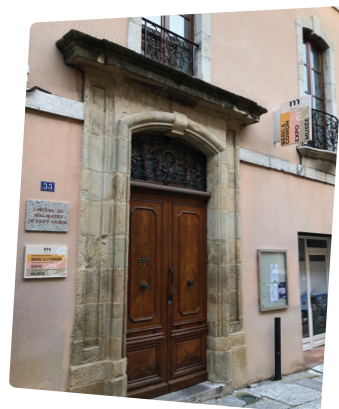
L'Hôtel Malmazet, 33 Grande Rue.