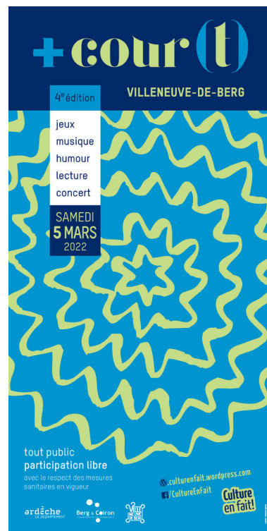
Place à la culture, samedi 5 mars 2022.

Quant au festival "D'une cour à l'autre", reviendra-t-il au printemps cette année ? La réponse est oui ! Notez bien les dates : samedi 28 et dimanche 29 mai 2022.