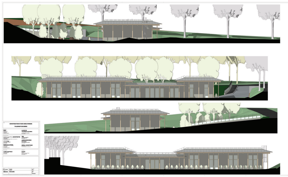
Les façades du bâtiment.