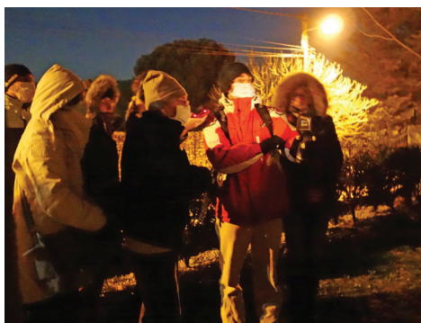
Balade thermographique à Saint-Jean-le-Centenier.

Ce début d'année 2022 marque le renouveau du service public de la rénovation. Au niveau national, le réseau FAIRE devient le réseau France Renov' et plusieurs évolutions sont à noter au niveau du fonctionnement des aides (dénominations, montants, durées...).