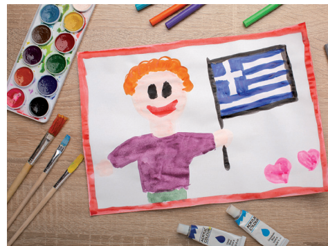
L'accueil périscolaire est devenu un Accueil collectif de mineur (ACM).

Pour la période 4, du 20 février au 7 avril 2023, les animatrices et animateurs travaillent actuellement sur la programmation des activités. La thématique sera " Qui s'aime ou qui sème, récolte..." et le planning de la première semaine, du 20 au 25 février 2023, sera élaboré et communiqué le vendredi 17 février au plus tard.