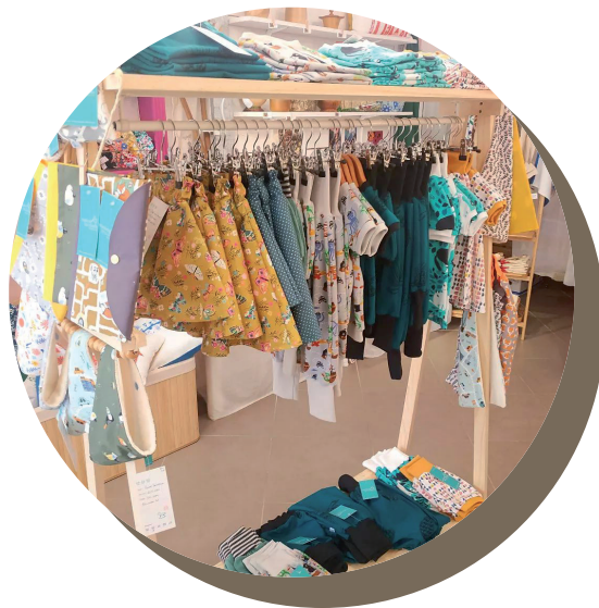
Vêtements pour bébés et enfants de 0 à 6 ans.

« Créatrice textile installée depuis peu à Villeneuve de Berg, je conçois des vêtements évolutifs qui grandissent avec l'enfant et des accessoires pour bébés et enfants de 0 à 6 ans. Je propose sarouels, sweat-shirts, t-shirts, jupes, robes, shorts ainsi que des accessoires : bavoirs, serviettes de cantine, protège carnet de santé, tapis à langer... Je personnalise certains articles en brodant à la main un prénom ou des initiales. J'utilise des matières douces pour la peau, confortables à porter et faciles à laver. Mon travail est visible à l'atelier sur rendez-vous, sur mon site internet ou dans des boutiques de créateurs dont la liste est sur mon site internet. » Marabout, bout d'ficelle - Isabelle Burgos - contact@maraboutboutd'ficelle.com 06 88 17 29 87 - www.maraboutboutd'ficelle.com