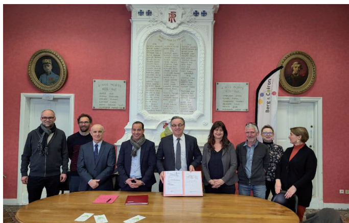
Le 9 février 2023, la convention cadre a été signée en compagnie de tous les partenaires.

Après la signature de la convention d'adhésion en mai 2021, cette dernière cadre et précise les ambitions retenues, son articulation avec le Contrat de relance et de transition énergétique et l'ensemble des moyens d'accompagnement existants au profit des collectivités locales, des entreprises et des populations des territoires. Elle indique aussi l'ensemble des engagements des différents partenaires pour la période du programme 2021-2026 : État, opérateurs, collectivités, secteur privé. Le jeudi 9 février, en présence de Monsieur le Préfet, la convention cadre a été signée.