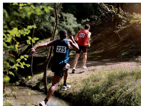
Une animation sportive ouverte aux trailers.