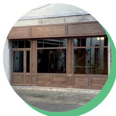
La devanture de l'atelier boutique Cabane, place Couverte, actuellement en cours de finition.

Vous pourrez également découvrir le travail d'Alice Corbel. Depuis 2020, elle confectionne à la main des chaussures fermées du 36 au 46, 100 % cuir et semelle caoutchouc. En plus de ces différents modèles, Alice vous proposera une petite gamme de maroquinerie : sacs bandoulières, sacs banane, portefeuille, porte-monnaie, pochettes, étuis à lunettes, ceintures... "Cabane" sera dédiée à la fabrication et à la vente, mais également au partage et à l'apprentissage : Alice et Roxanne proposeront des ateliers, initiations aux arts du cuir et au travail de la terre pour enfants et adultes.