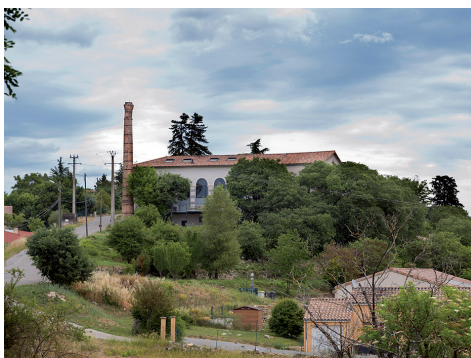
La filature, photographiée par Jean-Charles Gros.

L'ancienne filature, située sur la crête de Serrelonge, est le seul bâtiment industriel encore nettement identifiable à Villeneuve.