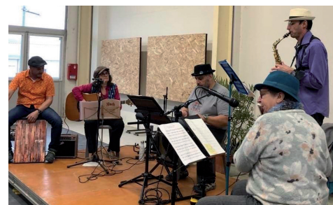
L'orchestre Buena vista centre social club.