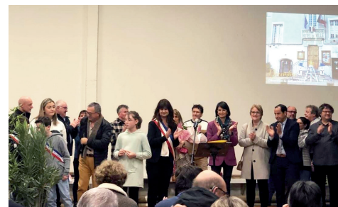
Une cérémonie avec des remises de médailles de la ville.