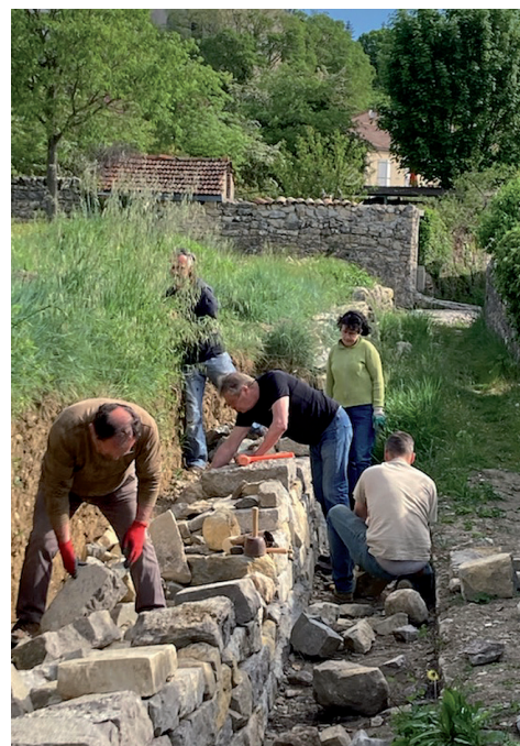
Restauration d'un mur en pierres sèches : c'est fait !

Un grand merci aux bénévoles participants, à l'association de Protection du patrimoine de Villeneuve-de-Berg, à M. Almagro pour les pierres apportées ! Le chantier a été soutenu par la démarche de protection et de valorisation de la vallée de l'Ibie et par la région Auvergne-Rhône-Alpes.