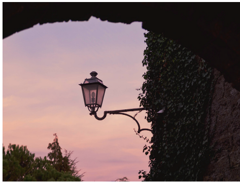
Une économie d'environ 14 000 € par an.

Lors du conseil municipal de décembre, la décision a été prise à l'unanimité d'éteindre l'éclairage public sur certaines tranches horaires modulables si nécessaire (de 23h à 5h du matin du 30 septembre au 30 avril et à partir de minuit du 1 er mai au 29 septembre sans rallumage le matin). Cette mesure a été