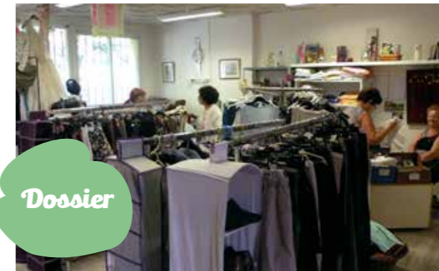
Le nouveau Kfé Fringues, premier arrivé "O locaux solidaires" ouvert par le centre socioculturel.

En installant un pôle dédié à la solidarité dans l'ancien centre de tri postal, le centre socioculturel La Pinède accentue son action en faveur des familles en difficulté.