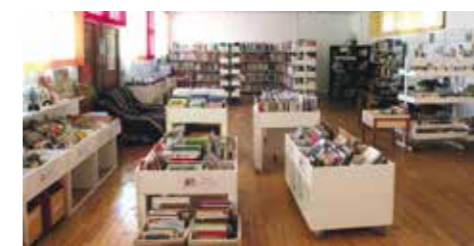
La bibliothèque municipale sera abritée par un bâtiment flambant neuf de 500 m².

Avec le soutien financier de l'État, de la DRAC et des collectivités, le nouvel équipement devrait sortir de terre fin 2020 début 2021. 500 mètres carrés dédiés aux activités de la bibliothèque, avec un espace contes et l'hébergement du centre multimédia.