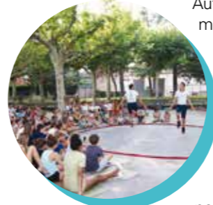
La Cie Facile d'excès.

Cette année encore, les festivités de l'été ont été marquées par la diversité des propositions faites au public. Avec une soirée supplémentaire, les mardis villeneuvois se sont déroulés dans une atmosphère festive et conviviale.