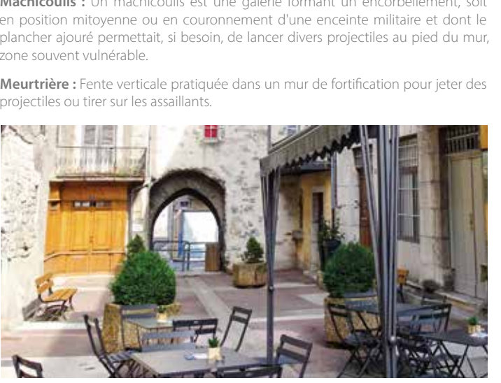
Textes rédigés par Elodie Blanc historienne, guide, conférencière et animatrice en licence professionnelle guide conférencier.