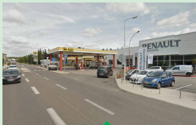
Banalisation de l'entrée de ville avec la souveraineté de la voiture, des espaces de circulation et des parkings

► Mettre en place des permanences de conseil architectural et paysager auprès des entrepreneurs et porteurs de projet.