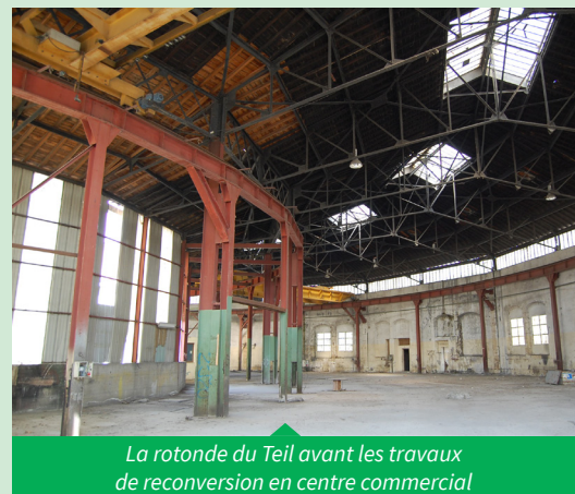
La rotonde du Teil avant les travaux de reconversion en centre commercial